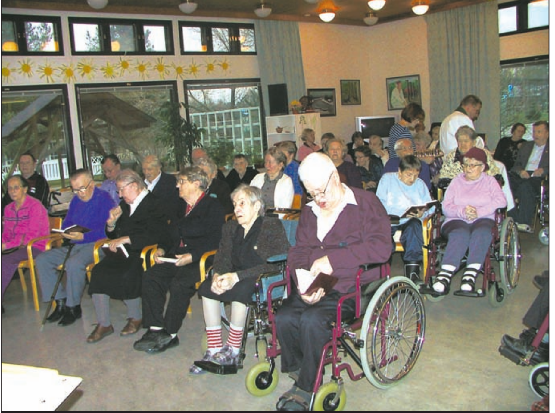
Päiväkeskuksen sali täyttyi Pyhäinpäivän palvelukseen ja ehtoolliselle osallistujista.

Keskiviikkoiltana oli vuorossa omaisten ilta. Sinne oli kutsuttu asukkaiden sukulaisia ja läheisiä viettämään yhteistä hetkeä kahvitelun merkeissä sekä tutustumaan toimintaan.