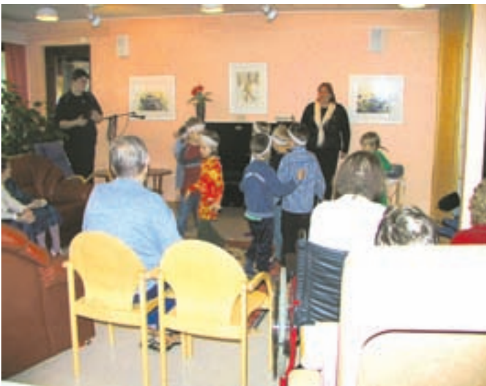
Ohjelmat oli harjoiteltu huolella ja ne sujuivat hyvin.