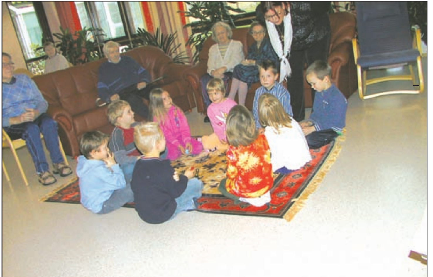
Pirttirannan päiväkodin eskarilaiset esiintyivät vanhusten iloksi.