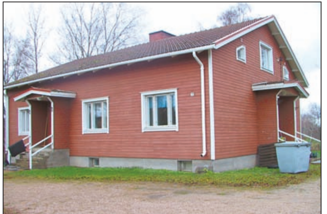
Työttömien yhdistys sai käyttöönsä hyvät tilat Peltolan pappilasta.